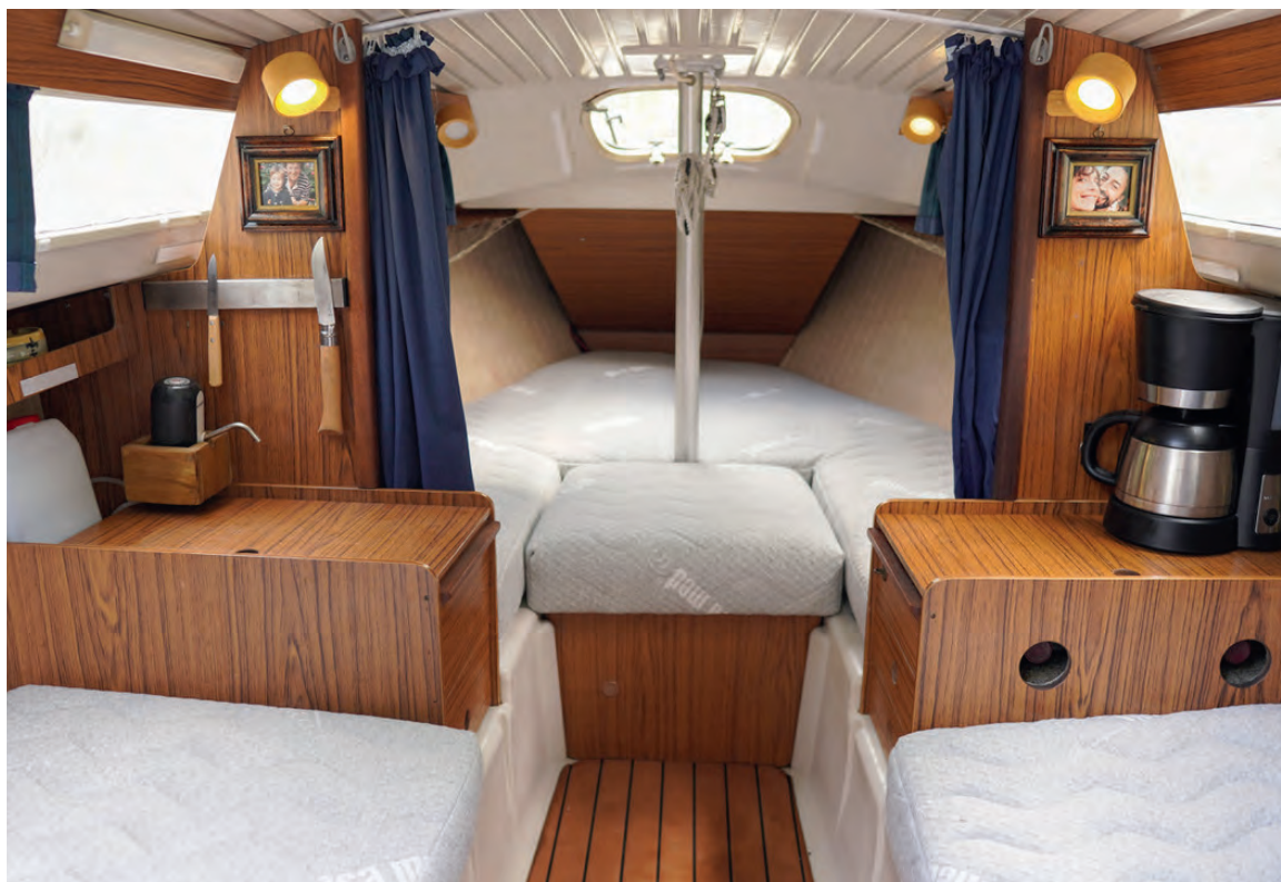
Auch auf einer Matratze aus einem Stück können zwei Erwachsene bequem schlafen