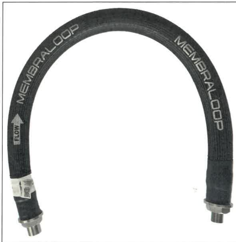
Abb. 2: Foto des getesteten Filtrationsmoduls.